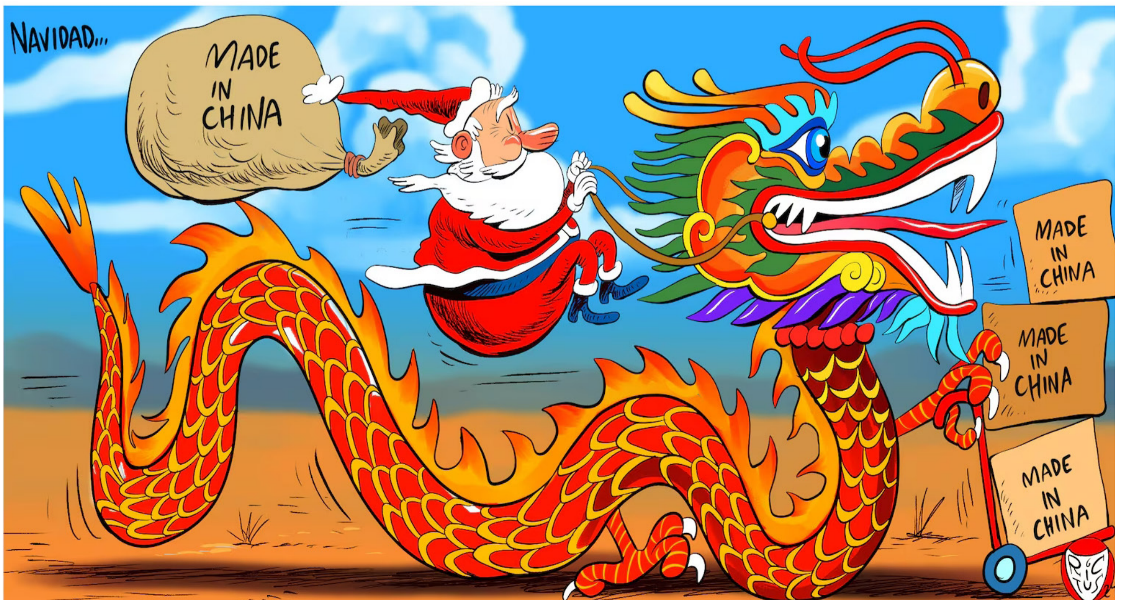
Retomado de El Financiero por su buen humor