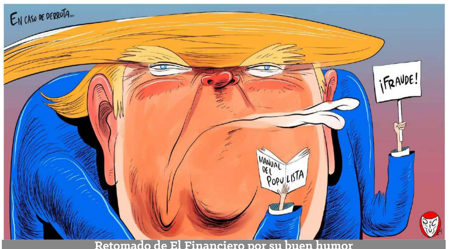
Retomado de El Financiero por su buen humor

Se necesita unidad nacional con hechos tangibles de parte de la presidenta Sheinbaum, que nos hagan reconocernos como ciudadanos que convivimos, sin exclusiones, bajo una misma bandera, en igualdad de derechos y con un destino compartido.