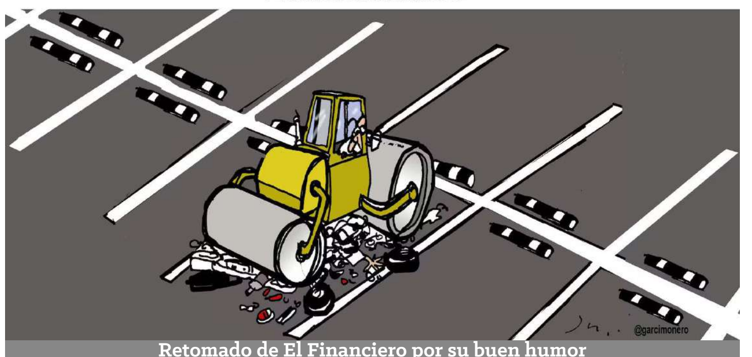
Retomado de El Financiero por su buen humor