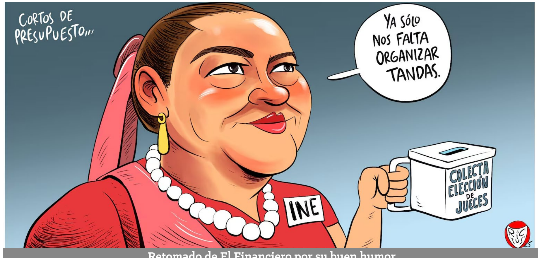
Retomado de El Financiero por su buen humor

Bajo esta perspectiva del llamamiento a la participación responsable, la ruta viviente ha de ser una constante a la concordia, signo e instrumento de unidad armónica de la diversidad. Por desgracia, todavía no hemos llegado a realizar esta proclama de evolución, la de hermanar de veras cada latido con la debida quietud. Nos falta esa plenitud anímica, en su más alta expresión de sacrificio, que la podemos alcanzar como sanación cuando nos reencontremos con la mística del verso. Es cuestión de volverse corazón, o si quieren, de revolverse como poetas contra sí, dejando nuestras miserias terrenales. Lírica que nos engrandecerá el órgano, haciendo de la viva inspiración, la parte que nos resplandece e ilumina, a vivir el recogimiento en la acción.