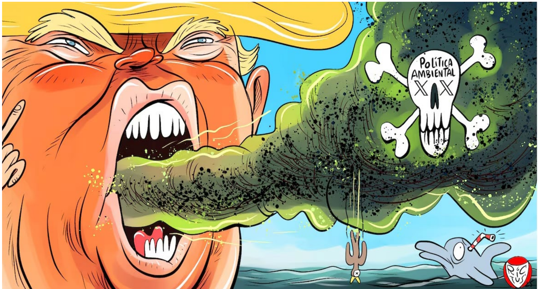
Retomado de El Financiero por su buen humor

La docilidad en este sentido de comunión es, por consiguiente, raíz de entendimiento y conciliación, tanto interna como externa. El espejo del alma está ahí, como fuente de profunda paz de la conciencia, ante