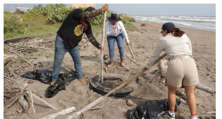
para proteger los recursos naturales y garantizar un entorno saludable para las futuras generaciones.

Esta acción es parte del compromiso continuo de la administración municipal