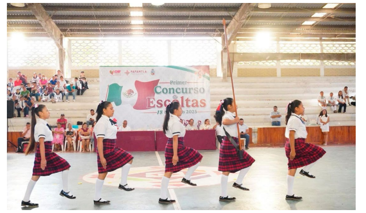
Este evento reafirma el compromiso de la administración municipal con la formación y desarrollo integral de los estudiantes en la región.