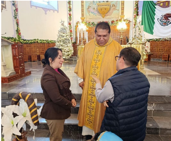
DELHY GALICIA Papantla, Veracruz

El alcalde de Papantla, Mtro. Gonzalo Flores Castellanos, inició el año reafirmando su compromiso con los valores espirituales y comunitarios, al dedicar su primera acción del 2026 a fortalecer la fe y el espíritu, como base para el trabajo y la toma de decisiones en beneficio del municipio.