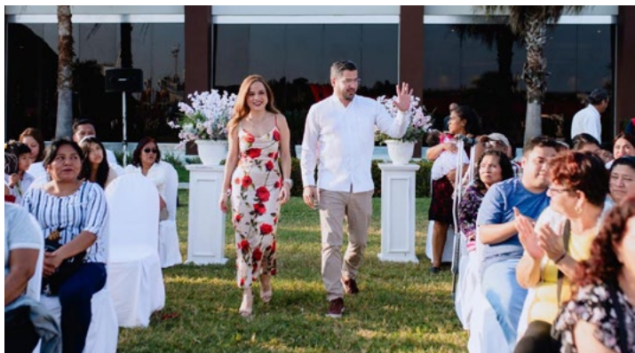
REDACCIÓN NORESTE Tuxpan, Veracruz

En un ambiente de celebración y legalidad, se llevó a cabo la campaña “Matrimonios 2026”, donde 157 parejas contrajeron matrimonio civil, dando certeza jurídica a sus familias y fortaleciendo el núcleo social del municipio. La recepción se realizó en el jardín del Hotel Holiday Inn Tuxpan Convention Center, espacio donde las parejas, acompañadas de sus familiares, vivieron este momento significativo. Gracias al trabajo coordinado del H.