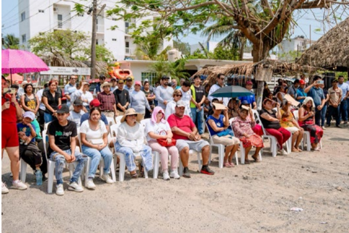
REDACCIÓN NORESTE Tuxpan, Veracruz

De la gestión a los hechos: inicia obra esperada por habitantes de poblado San Antonio