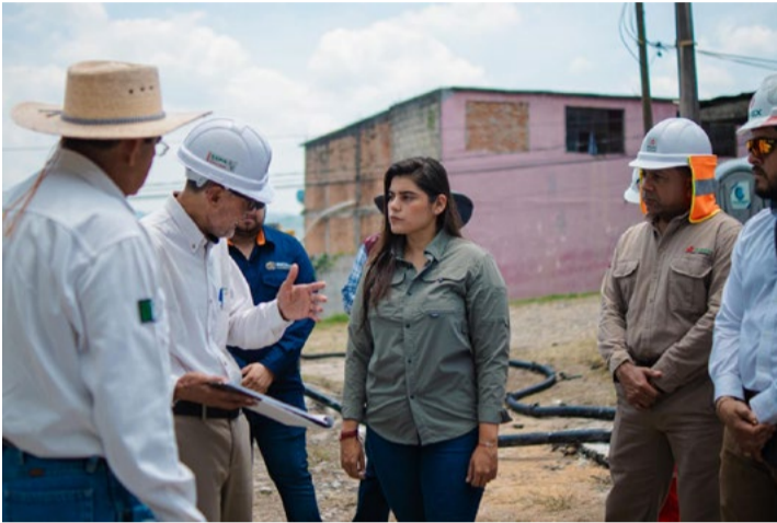
REDACCIÓN NORESTE Poza Rica, Veracruz

Coordinación entre autoridades municipales y Pemex busca reducir riesgos y mejorar el entorno urbano