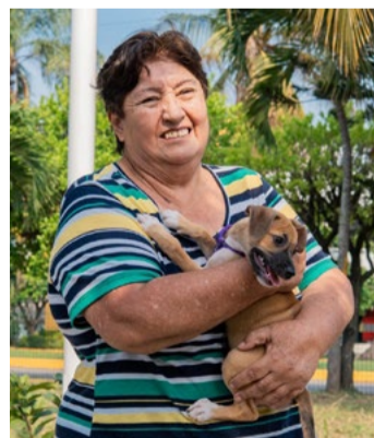
REDACCIÓN NORESTE Poza Rica, Veracruz

Entre sonrisas y miradas que conectan, más de una familia encontró a su nuevo integrante durante la reciente convivencia de adopción canina realizada en el municipio.