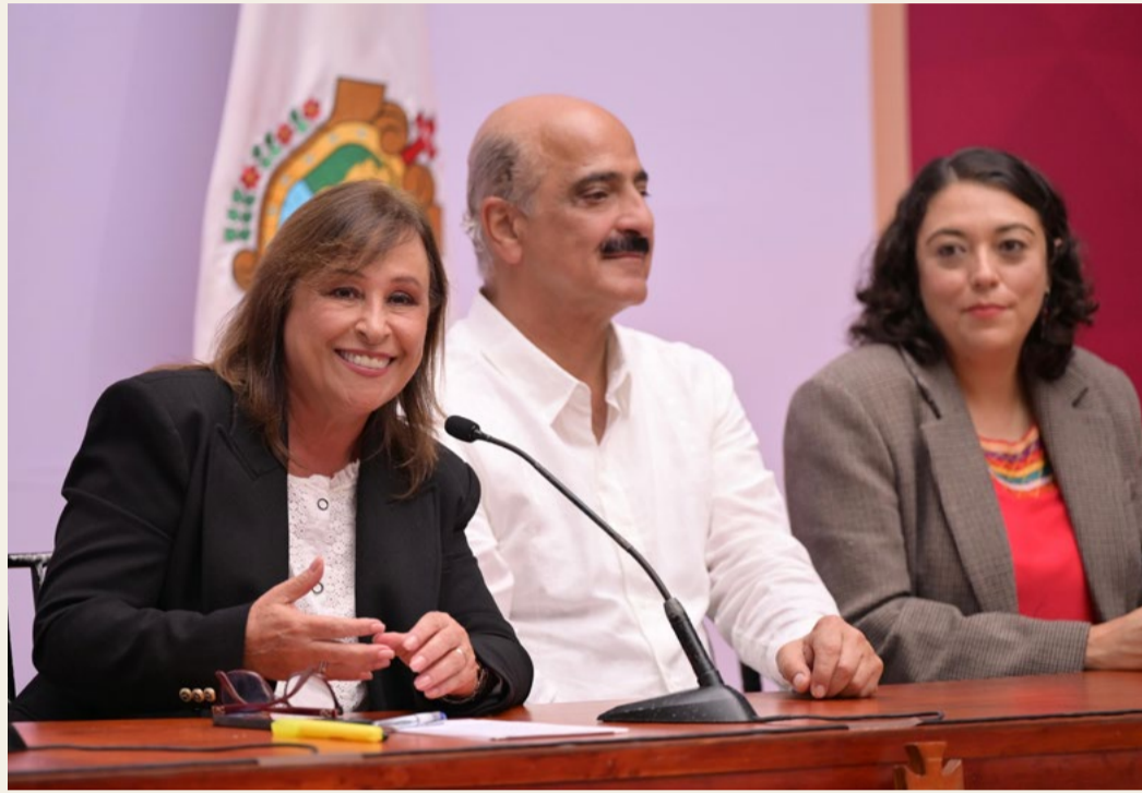
mantiene la coordinación entre dependencias estatales, federales y municipales para garantizar la seguridad de asistentes, artistas y prestadores de servicios.