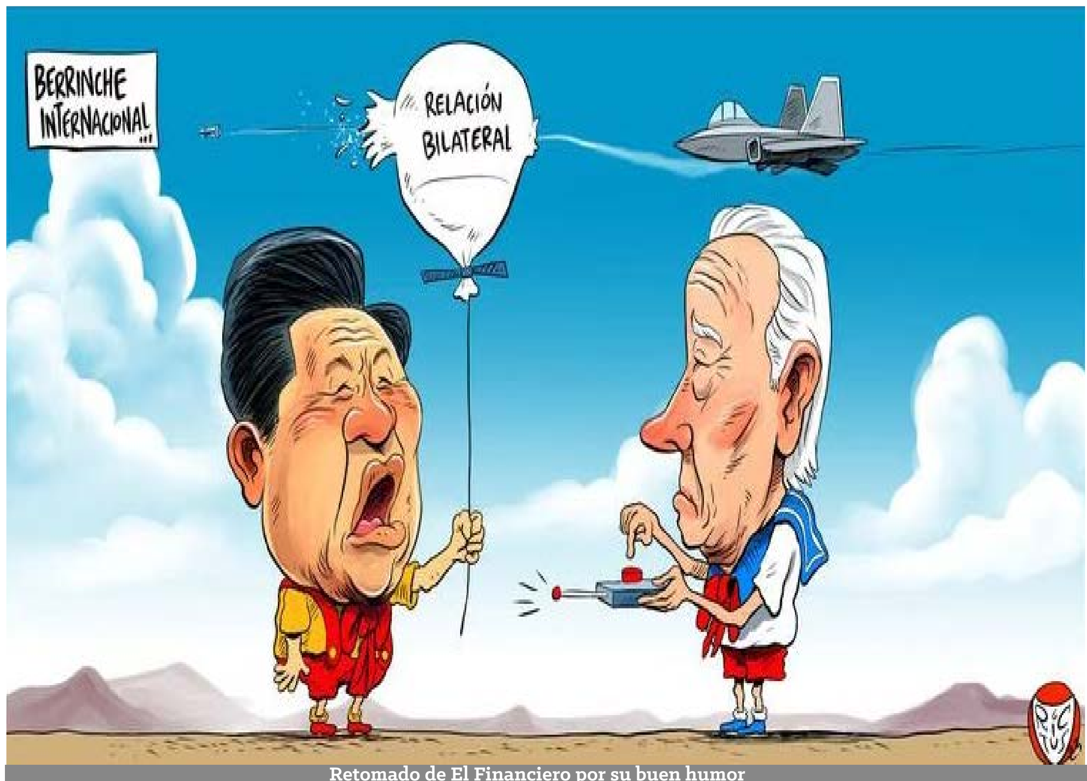
Retomado de El Financiero por su buen humor

diario La Jornada publicó como nota principal: "Pagaba García Luna a El Universal para limpiar su imagen". Sin fuente en la cabeza, hizo suya la acusación. No fue un titular, sino una proclama. Nado sincronizado, pues. Villarreal espera que no le den 20 años de cárcel, y obtener asilo en Estados Unidos. Hasta ahora, no hay una sola prueba contra García Luna. Al contrario, la debilidad del caso lo fortalece a él. La petición de arrestar a García Luna ya había sido solicitada a la fiscalía en Houston, y fue rechazada por insostenible. Aunque el jurado, que no conoce los entretelones de la faramalla contra el exsecretario de Seguridad de México, puede ceñirse a la tradición y declararlo culpable, como ocurre en 99.6 por ciento de los casos llevados a una corte por fiscales federales, de acuerdo con el Pew Research Center, citado por Dolia Estévez. Con esa estadística en contra, García Luna se negó a declararse culpable. ¿Por qué? Tal vez sea inocente. Esta es opinión personal del columnista