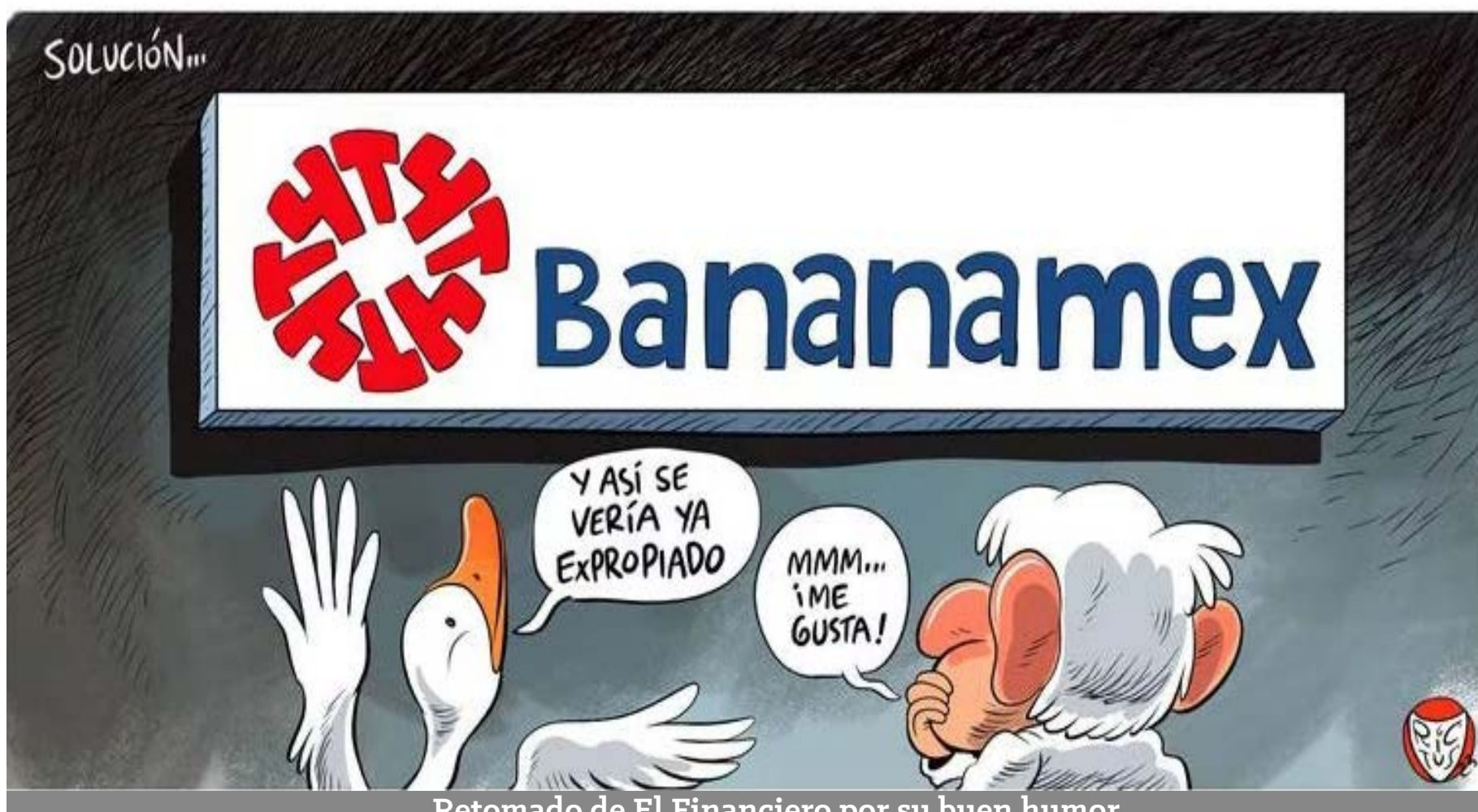
Retomado de El Financiero por su buen humor