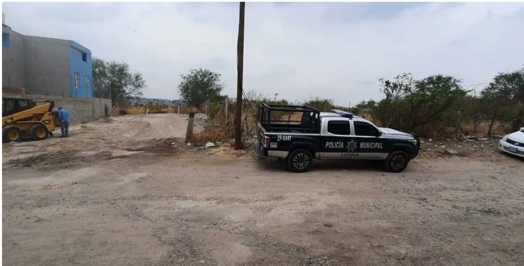
La zona fue acordonada y la obra tuvo que parar debido a las investigaciones llevadas a cabo por la Fiscalía del Estado de Jalisco. El cráneo fue recogido por el Instituto Jalisciense de Ciencias Forenses para trasladarlo a sus instalaciones donde será analizado y resguardado.

Los oficiales del ex Villa Maicera llegaron hasta el sitio y corroboraron con ayuda de los paramédicos municipales que se trataba de un cráneo que ya no contaba con tejido, se determinó por parte de los servicios médicos municipales que ya tenía una avanzada evolución cadavérica sin precisar el tiempo.