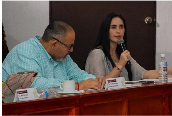
"De la Calle a la Cancha" es un evento dirigido a jóvenes que han enfrentado situaciones

adversas en su vida y que encuentran en el fútbol una herramienta de superación