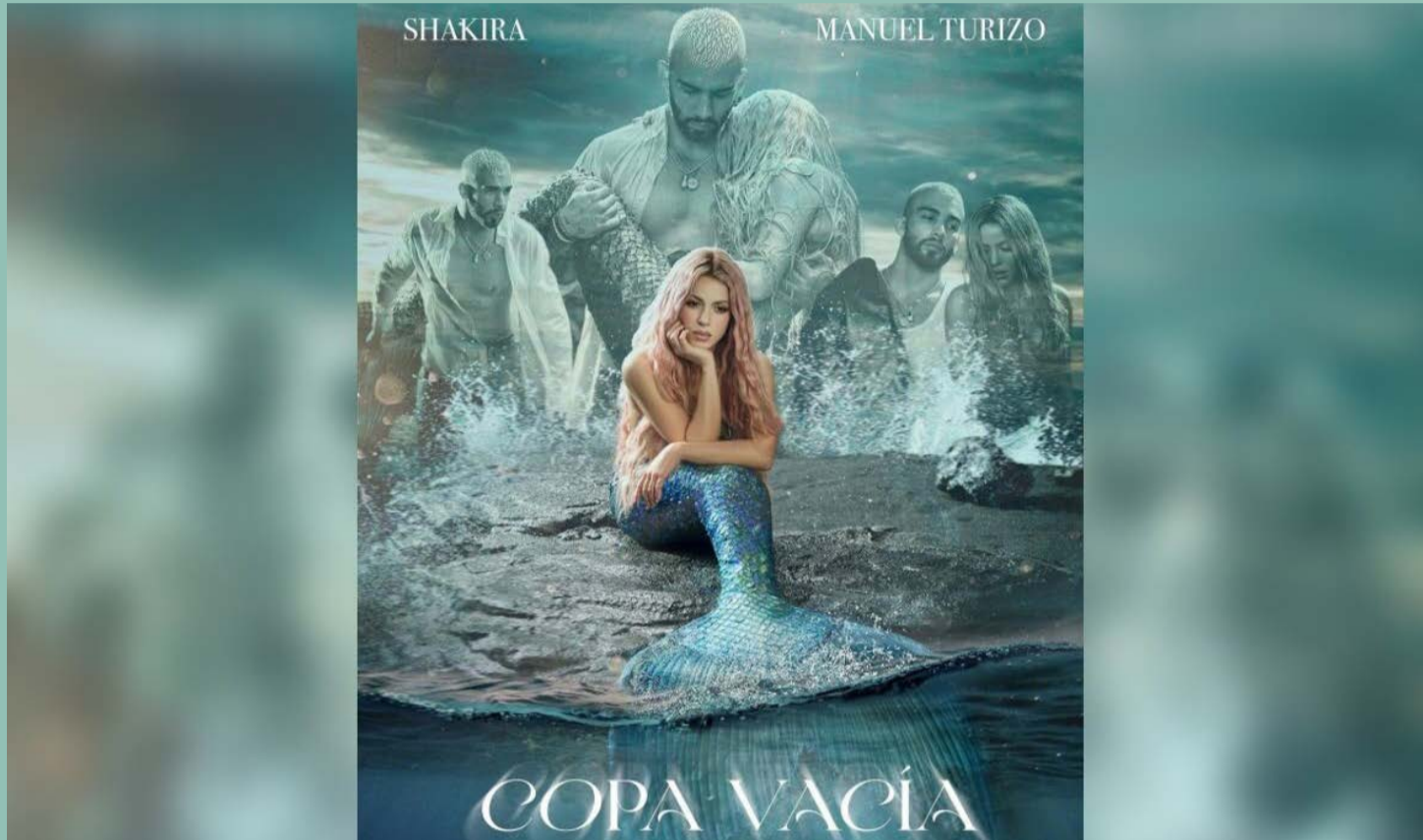
Acróstico y Te Felicito. Shakira estrena Copa Vacía

Este es el sexto tema musical que Shakira lanza luego de terminar su relación con Gerard Piqué. Recordemos que su regreso se dio con la sesión con Bizarrap, pasando por canciones como Monotonía, TQG,