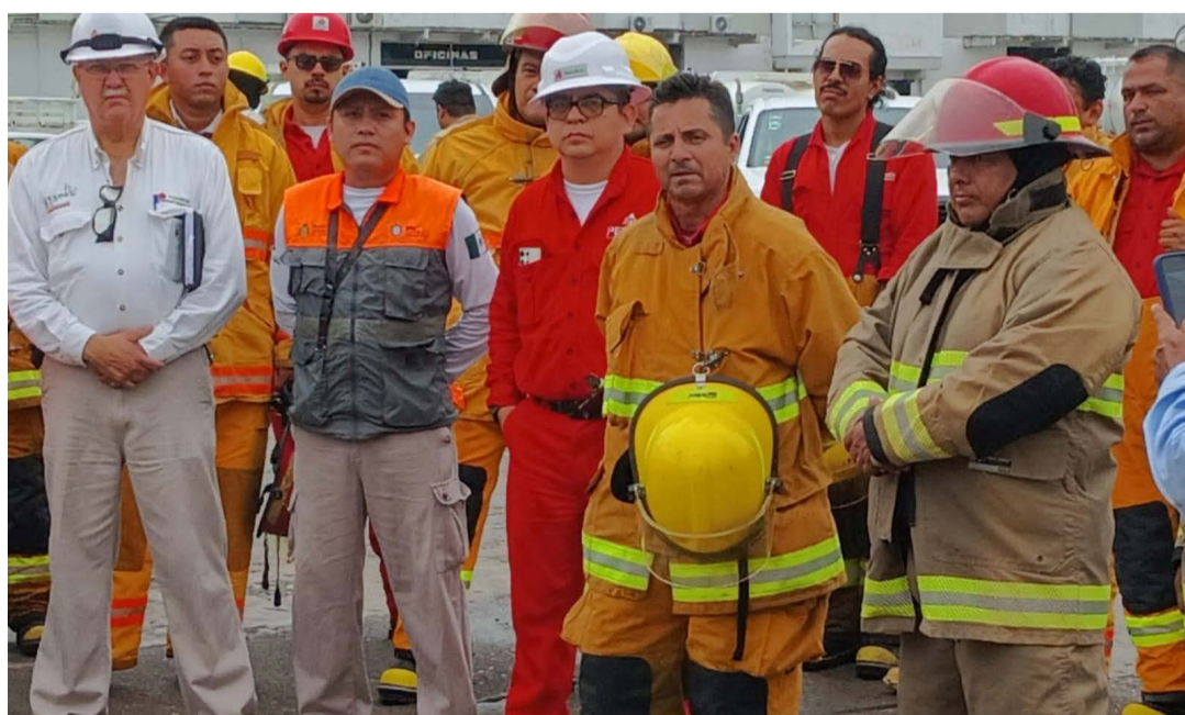
perifoneo en las zonas evitar que la población te la movilización de aldañas al lugar, para cayera en psicosis a cuerpos de emergencias.