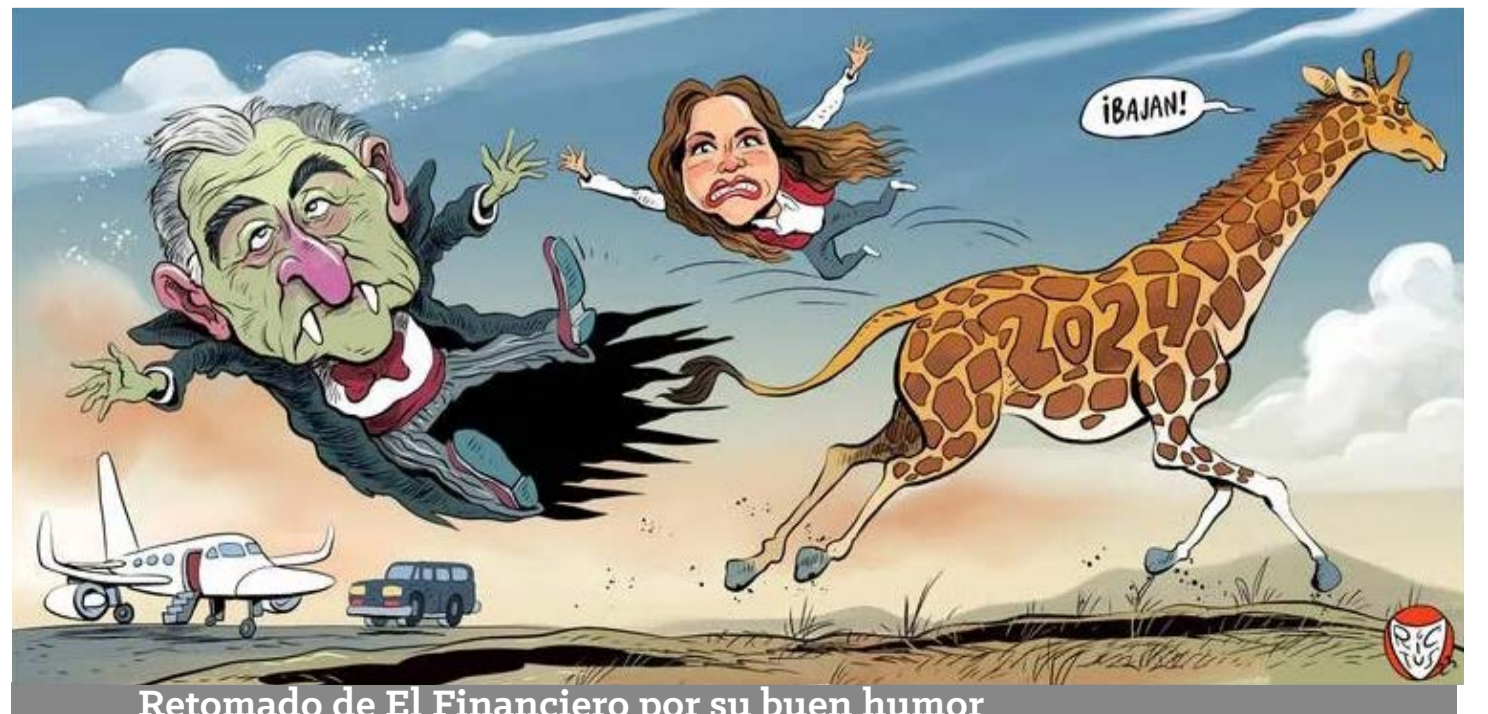
por su buen humor