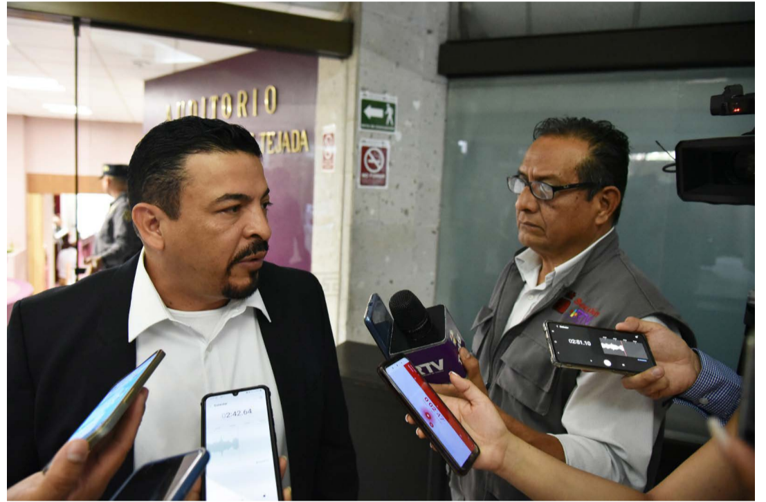
aquí del Congreso del Estado ni un solo peso para andar de una corcholata, ni un solo no le vamos a dar a nadie haciendo campaña a favor peso".

Y advirtió: "Digamos que diputado ha facturado algún gasto con algún viaje para ir a ver alguna corcholata, porque eso no está permitido y yo no estoy de acuerdo. (Los diputados) pueden ir al evento, sí, pero que pongan de su bolsa. De