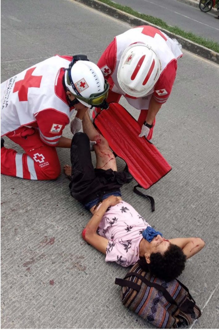
REDACCIÓN NORESTE Tuxpan, Veracruz

Responsable huyó de la zona del percance