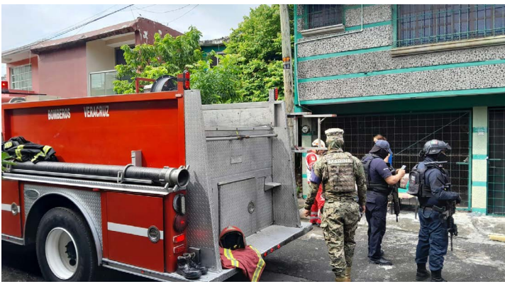
ARTURO ESPINOZA Veracruz, Veracruz

D os intoxicados y daños materiales cuantiosos fueron el saldo del incendio de una casa en el Infonavit Buenavista, municipio de Veracruz. El siniestro se registró este