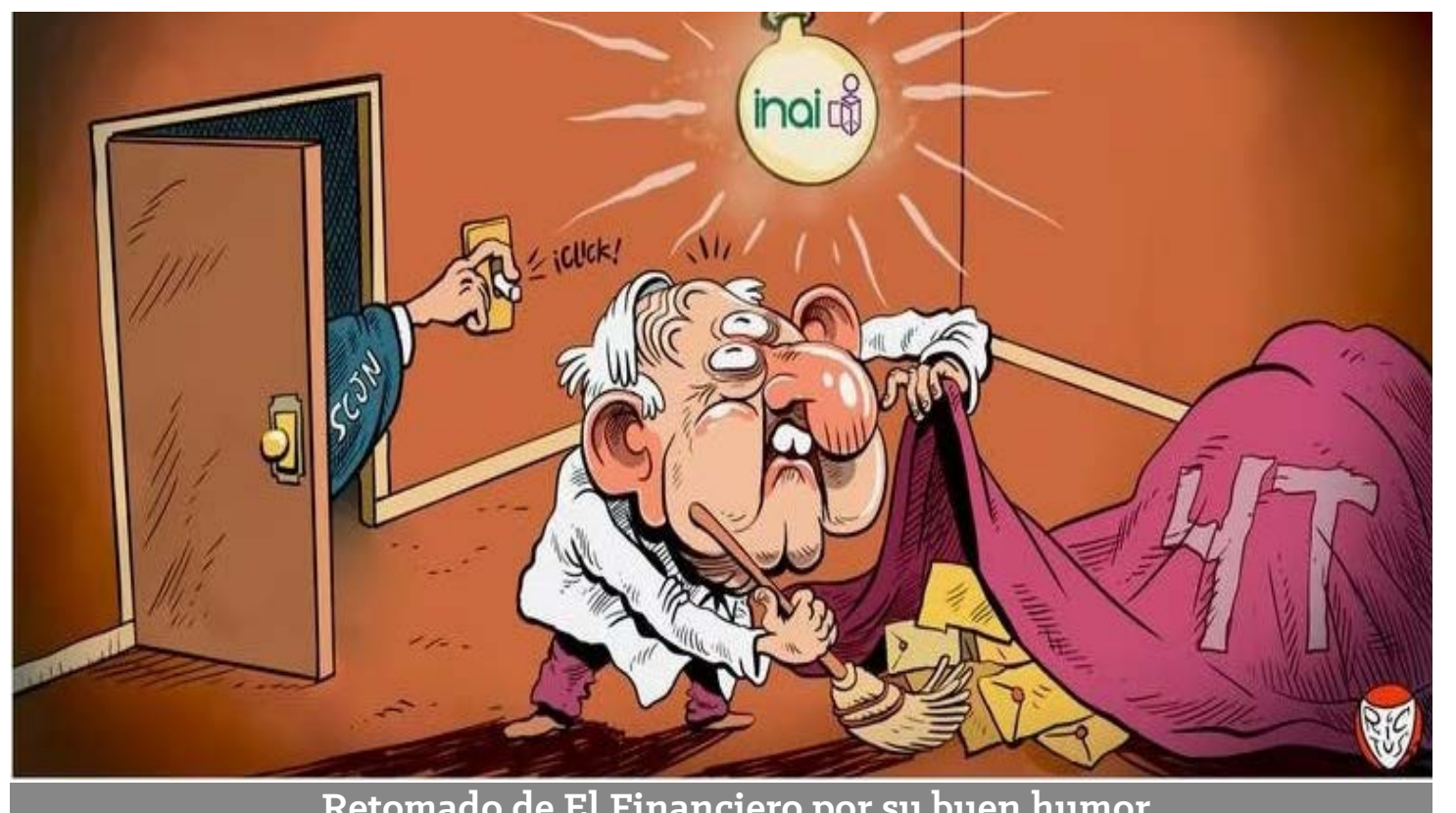
Retomado de El Financiero por su buen humor

El encuentro está programado para la siguiente semana y abordarán temas sobre cómo desarrollar el ecosistema de finanzas digitales, inclusión financiera, nuevas tecnologías para su expansión y desarrollo sostenible; sin duda, será interesante el intercambio de ideas, y veremos si se toca el tema que otras industrias han pedido y que es cancha pareja en temas regulatorios y si no da la sorpresa y se convierte en la minibancaria tecnológica. Por lo pronto, la moneda está en el aire.