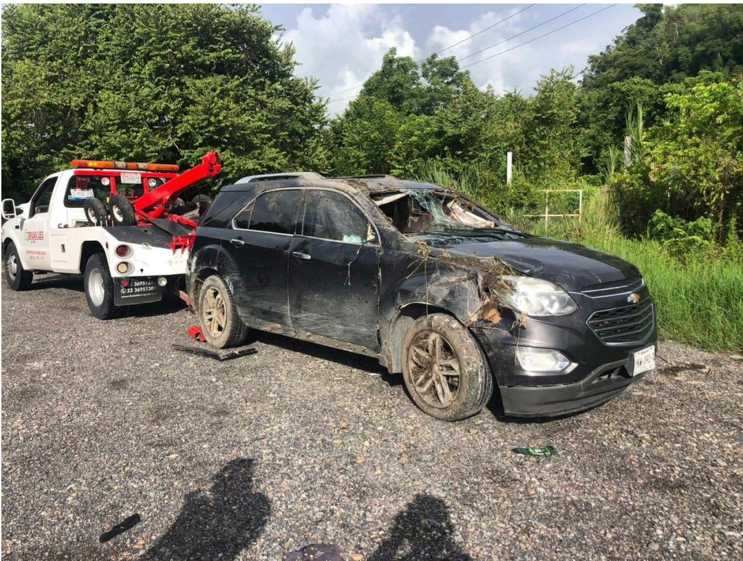
REDACCIÓN NORESTE Papantla, Veracruz

Aparatosa volcadura dejó como saldo cuantiosos daños materiales y los integrantes de una familia que iban a bordo de la unidad se llevaron un gran susto,