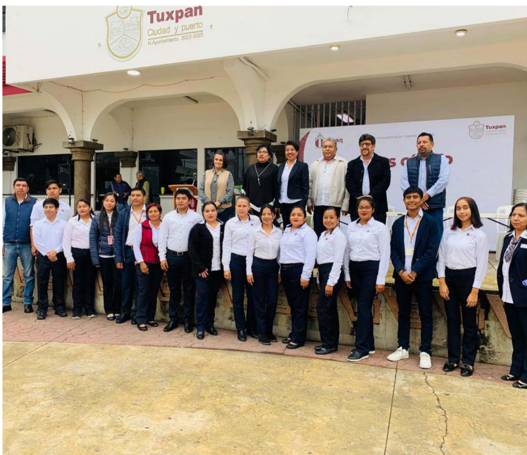
REDACCIÓN NORESTE Tuxpan, Veracruz

El gobierno de Tuxpan realizó esta mañana el lunes cívico en el marco del aniversario de la promulgación del Plan de Ayala.