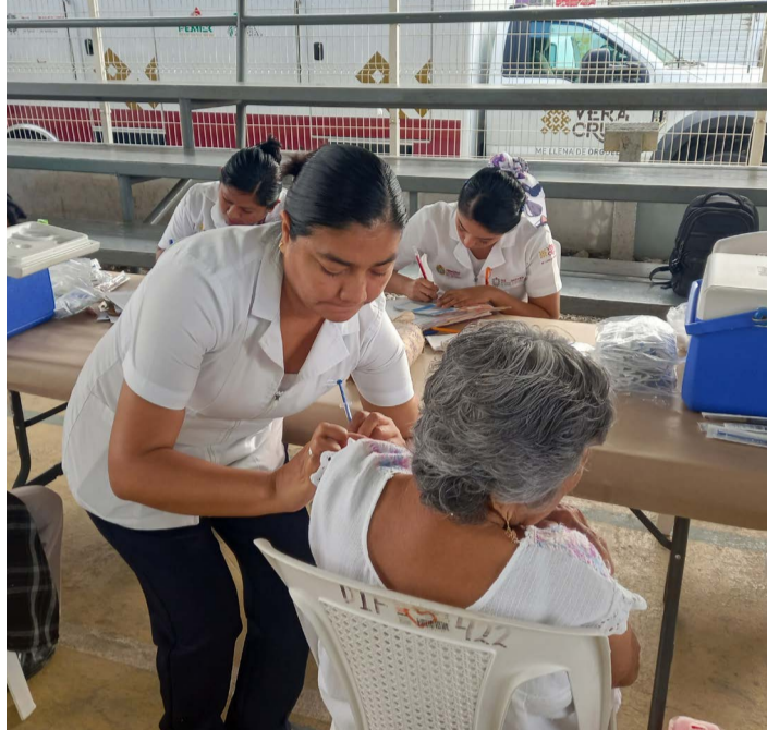
enfermedad del coronavirus, de forma mínima y sin misma que prevalece, aunque complicaciones.

Finalmente comentan, de la gran responsabilidad que tiene el Sector Salud no tan solo en la lucha contra el dengue, cáncer y otras acciones preventivas, si no la continuidad de control en la