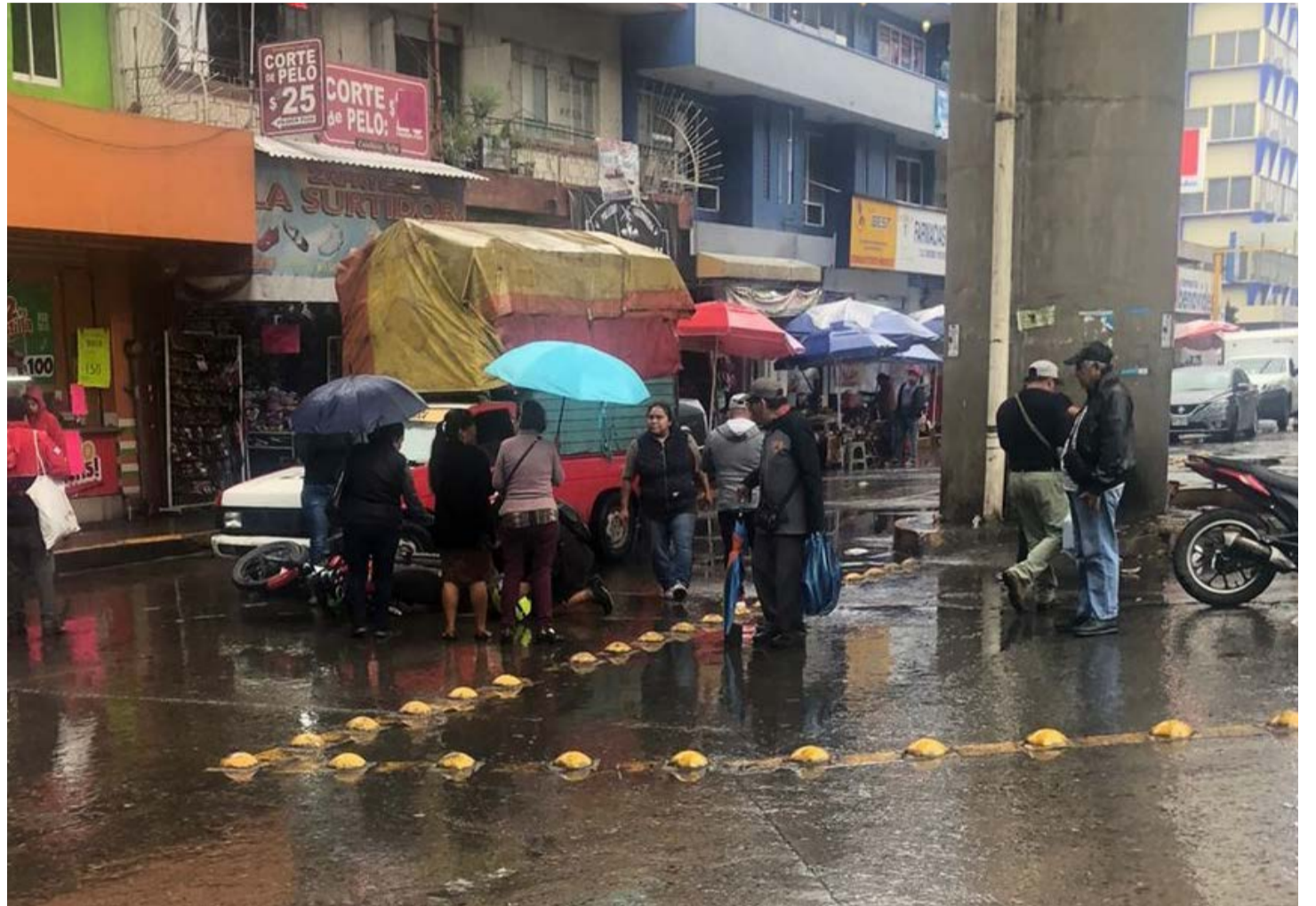
REDACCIÓN NORESTE Poza Rica, Veracruz

Este lunes alrededor de las 12:00 horas se registró un accidente vial, luego de que una camioneta de transporte público de mudanza marcada con el número 203 arrollara a una mujer quien viajaba