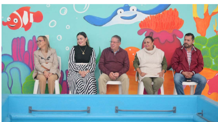
REDACCIÓN NORESTE Tuxpan, Veracruz

Con el que se brindarán 1,600 sesiones de rehabilitación