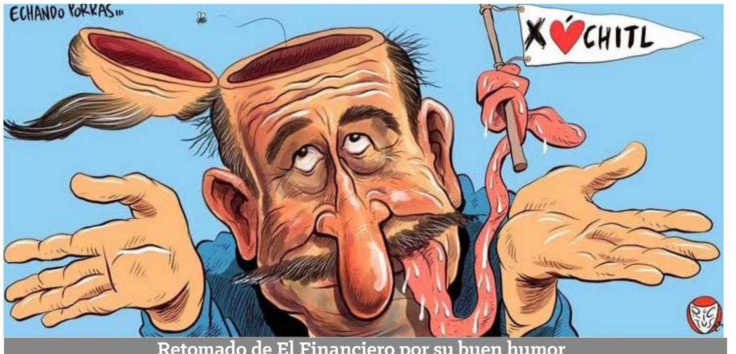
Retomado de El Financiero por su buen humor