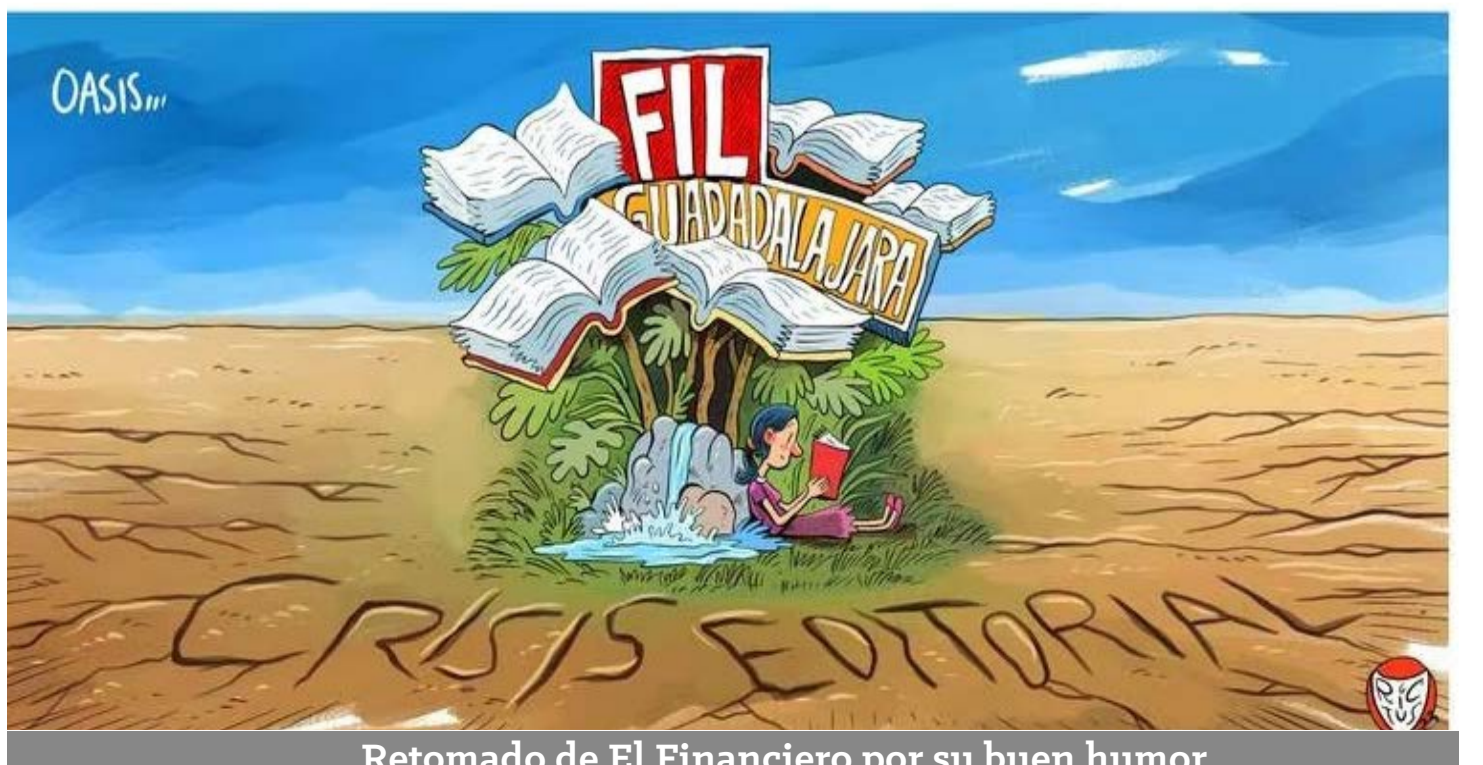
Retomado de El Financiero por su buen humor