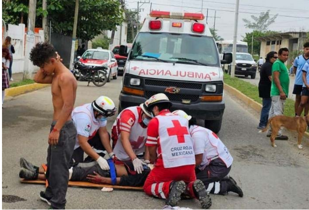
Elementos de Tránsito y Policía Municipal no pudieron intervenir debido a que los familiares de los jóvenes accidentados retiraron la motocicleta.