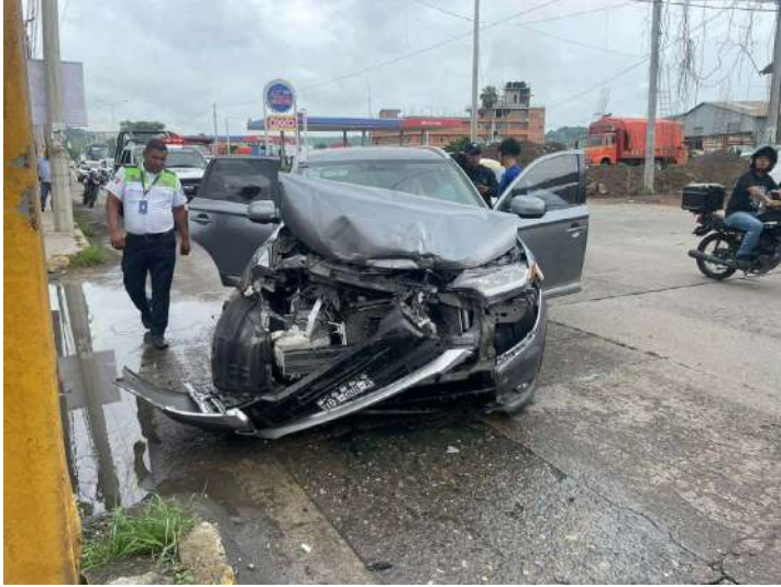
REDACCIÓN NORESTE Poza Rica, Veracruz

Ayer se registró un fuerte accidente sobre la avenida Puebla, a la altura del bulevar Ejército Mexicano, donde dos vehículos colisionaron.