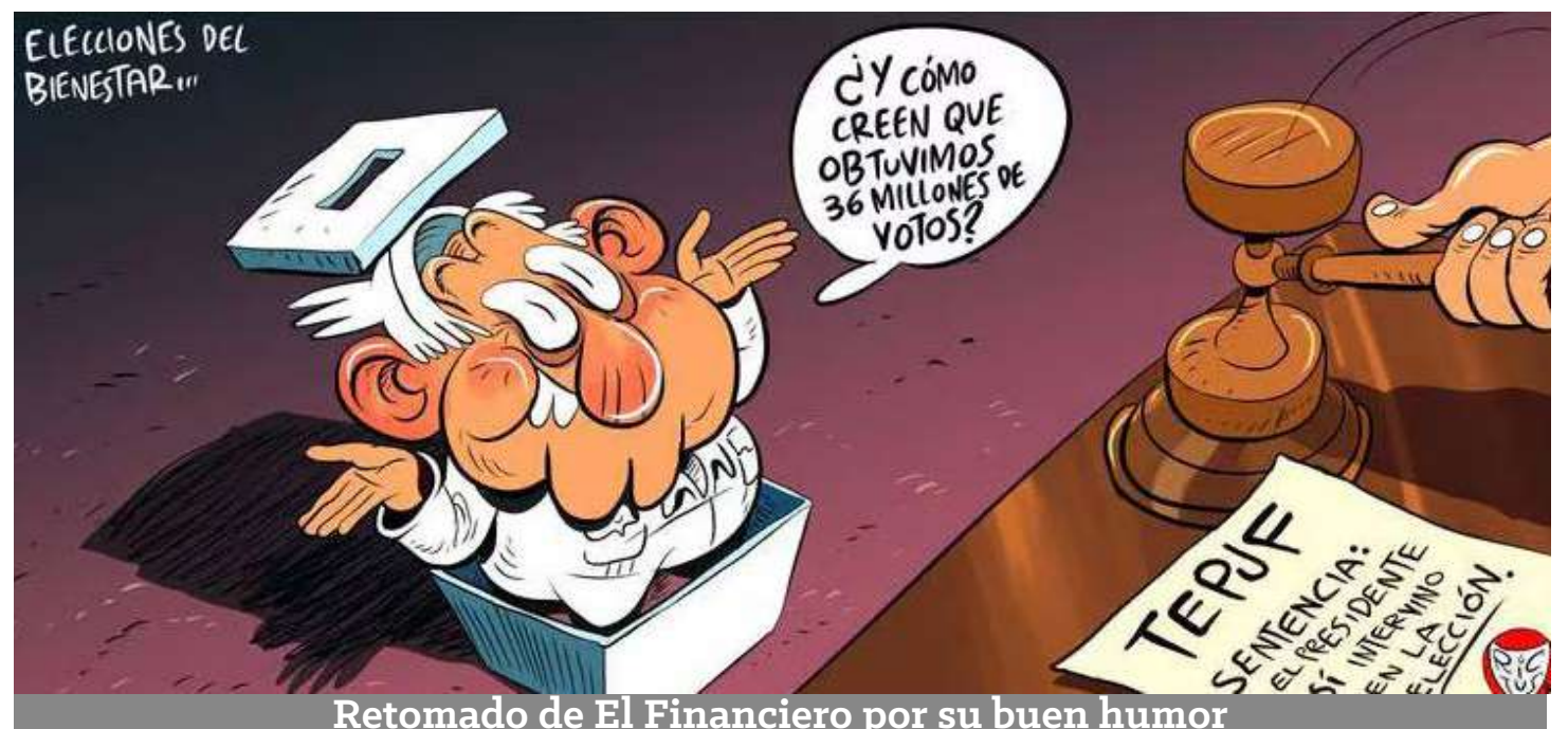
Retomado de El Financiero por su buen humor