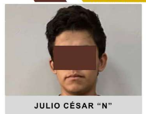
JULIO CÉSAR "N"

"Se presume inocente y será tratado como tal en todas las etapas del procedimiento, mientras no se declare su responsabilidad mediante sentencia emitida por el órgano jurisdiccional" Art.13 del CNPP